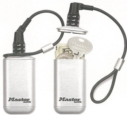
Mint egy vízhatlan strandi pénztárca

értékeinkre azok biztonságban vannak. Kiváló választás lehet gyermekek számára, vagy sportolást, szabadidős tevékenységet kedvelő személyek számára.