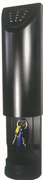
Elektromos kombinációval nyitható kulcsartó

Az egyik legegyszerűbb értékmegőrzőről rögtön a vízhatlan strandi pénztárca jut eszünkbe. A terméket kezünkbe fogva azonnal feltűnik a különbség, hiszen ennek a kis értékmegőrzőnek bizony jelentős súlya van. Fém kialakításának köszönhetően nagymértékben ellenáll a rongálásos támadásoknak, így a kővel, vagy kalapáccsal történő támadásnak, földhöz vágásnak, rálépésnek. A lezárást három számból álló kombináció biztosítja, kábeles kialakításának köszönhetően könnyedén rögzíthetjük táskához, asztalhoz, kerékpárhoz, csuklóhoz vagy valamely fix ponthoz. Nagy előnye, hogy hordozható, így biztosak lehetünk abban, hogy amíg mi nem figyelünk kisebb